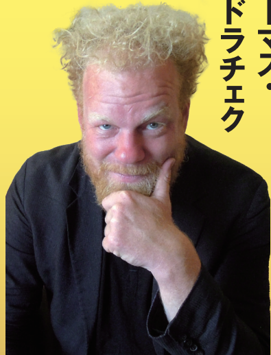
トーマス・ セドラチエク