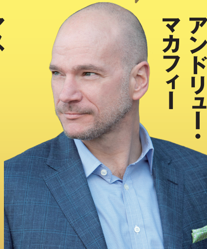
アンドリュー・ マカフィー