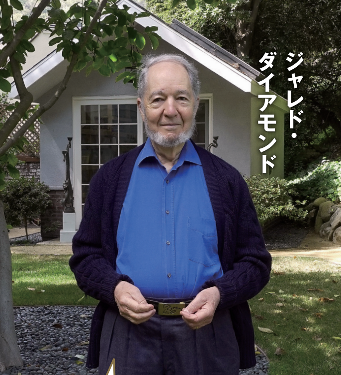
ジャレド・ ダイアモンド