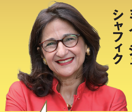
ミノーシュ・ シャフイク