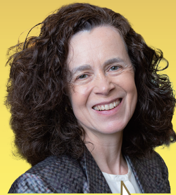
レベッカ・ ヘンダーソン