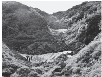
残雪と高山植物が登山道を彩る大沢の登り