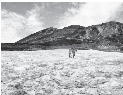
白雲岳避難小屋にショートカットする雪渓

狭い未舗装の道に心細くなる頃、ようやく大雪高原温泉の一軒宿・大雪高原山荘が姿を現す。温泉はすこぶるいい湯で、木彫りの熊の湯口から勢いよく源泉かけ流しの湯が注ぐ内湯、大雪山の一角を望む露天風呂も秀逸だ。風呂の造りも良く、内湯も露天風呂も男女別。登山者よりも秘湯ファンの訪れが多い人気の温泉宿となっている。なお、温泉を基点にした一周4時間半ほどの沼回りコースは、一帯が熊の出没地帯。入口のヒグマ情報センターで情報収集が必須だ。