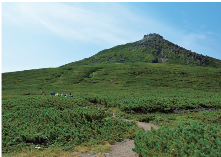
硫黄山方面への縦走路や羅臼からの登山道の分岐点、羅臼平から羅臼岳の岩峰を望む