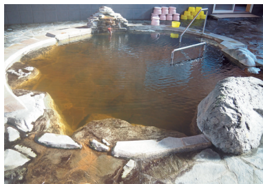
斜里温泉湯元館の源泉かけ流しの貸切風呂

斜里温泉湯元館 ☎0152-23-3486 ◆ 泉質=ナトリウム-炭酸水素塩泉 ◆ 源泉温度=55.5度 ◆ 鉄道/JR釧網本線知床斜里駅から徒歩25分 ◆ 車/女満別空港から約1時間15分、旭川紋別自動車道遠軽ICから約2時間30分 ※斜里温泉から清岳荘下の駐車場まで車で約50分