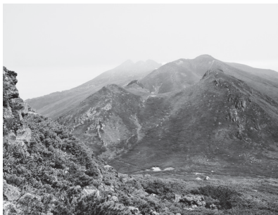
羅臼岳直下の岩場から硫黄山方面の眺望

岩尾別温泉は知床半島の秘湯というイメージだが、一軒宿のホテル地の涯は意表をつかれる鉄筋3階建ての近代的な建物だ。湯量は豊富で、館内に男女別内湯と混浴露天岩風呂(湯浴み着貸与)があり、日帰り入浴も夕方まで受け付けるので、登山者の利用も多い。また、駐車場外れの斜面に3段露天岩風呂、少し離れた河畔にこぢんまりとした滝見風呂もあり、ともに無料で人気がある。