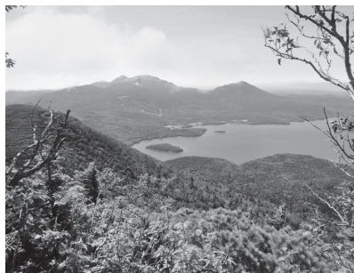
五合目付近から望む阿寒湖と雌阿寒岳