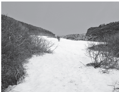
馬の背への急斜面は7月まで雪渓が残る