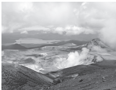
雌阿寒岳山頂から阿寒湖方面の眺望