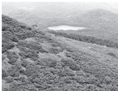
五合目付近の登りから望む樹海とオンネトー