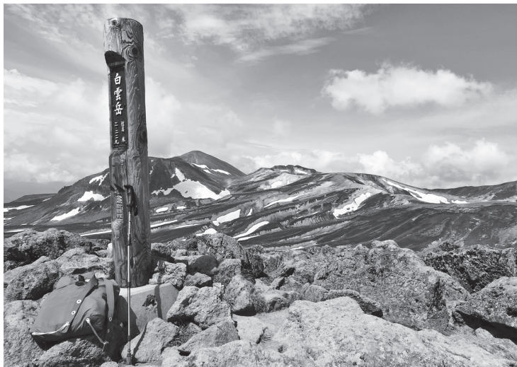
右手に北海岳から北嶺岳に続く縦走路がのびる尾根、左奥に旭岳を望む白雲岳の山頂