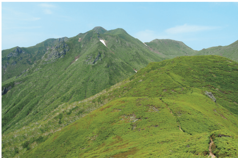
新道コースの熊見峠に続く尾根道から、意外と険しい山容の斜里岳を望む