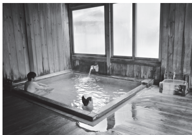
雌阿寒温泉「山の宿 野中温泉」の風情ある内湯