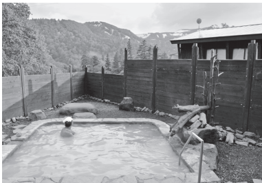
山岳展望も楽しみな大雪高原山荘の露天風呂

大雪高原山荘 ☎01658-5-3818 ◆ 泉質=単純酸性泉 ◆ 源泉温度=47.0度 6月10日～10月11日の営業 ◆ 鉄道 / JR石北本線上川駅からバス35分の層雲峡からタクシー 40分 ◆ 車 / 旭川紋別自動車道上川層雲峡ICから約1時間10分