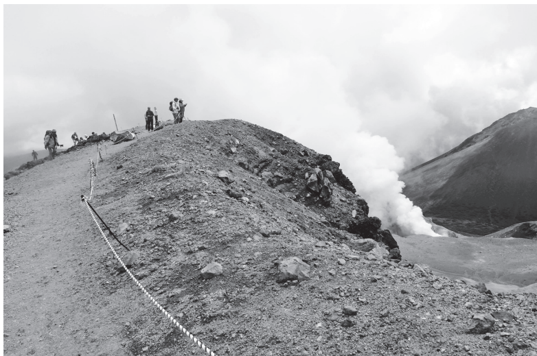
猛烈な水蒸気を上げる赤沼の火口を右手に見ると、まもなく雌阿寒岳の山頂だ

雌阿寒岳の登山口に湧くのが雌阿寒温泉だ。かつては別の温泉宿もあったが、現在は山の宿 野中温泉（旧名は野中温泉別館）1軒のみになってしまった。ユースホステルにもなっていた、閉館した本館は大正時代創業の老舗だった。硫黄泉の名湯と総アカエゾマツ造りの内湯の湯船が素晴らしく、露天風呂も野趣豊か。道東を旅する際には必ず足を運ぶ、私の北海道の温泉ベストテンに入る名湯である。ただし、1軒になってしまったため、なかなか泊まれなくなってしまったのが難点。立ち寄り湯は問題ないが、確実に泊まるには早めの予約が必須だ。