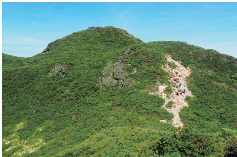
八合目から正面に雄阿寒岳を望みつつ、いったん九合目へ下る。左手の窪地は噴火口跡