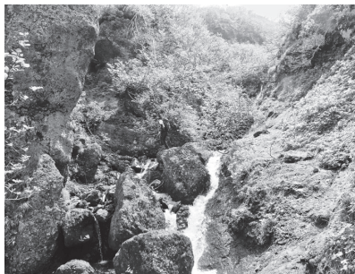
滝を高巻きしたり滑滝をよじ登る旧道コース