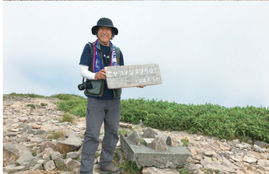
ニセコアンヌプリ 11