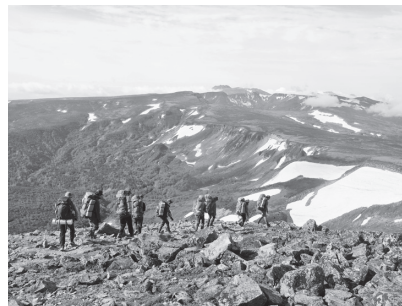
緑岳の山頂。遠望する岩峰はトムラウシ山