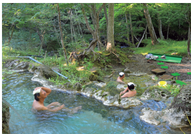
岩尾別温泉の無料開放されている露天岩風呂

ホテル地の涯 ☎0152-24-2331 ◆ 泉質=ナトリウム・カルシウム-塩化物・炭酸水素塩泉 ◆ 源泉温度=63.3度 4月下旬～11月上旬の営業 ◆ 鉄道／JR釧網本線知床斜里駅からバス50分(女満別空港からバス2時間15分)のウトロ温泉BT乗り換え20分、岩尾別温泉下車 ◆ 車／旭川紋別自動車道遠軽ICから約3時間、女満別空港から約2時間30分