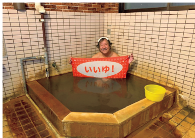
温泉民宿山口の男女別内湯は源泉かけ流し